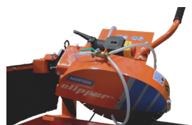
DÖNTHETŐ FEJ (90° - 45°)