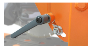
ÁLLÍTHATÓ BILLENŐKAROS VÁGÁSI MÉLYSÉG MARKOLAT